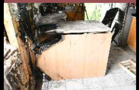
Analyse des hypothèses au point d'origine