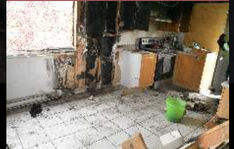
Nettoyage jusqu'au sol

Le module Déblai, reconstitution et analyse des sources d'ignitions, explique en détails comment effectuer de façon méthodique un déblai complet du secteur d'origine.